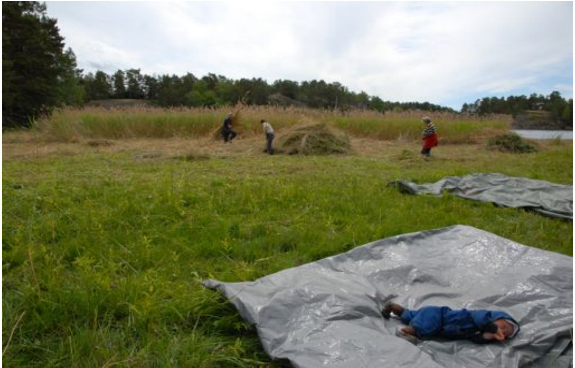
Område i, strandäng Femsund. Vasslåtter som restaureringsåtgärd 2010-06-19. Initialt är det viktigt med högt betestryck och och tidigt betespåsläpp. Framöver kan del med ängsnycklar gynnas av betesfredning under försommaren. (2010-05-24)