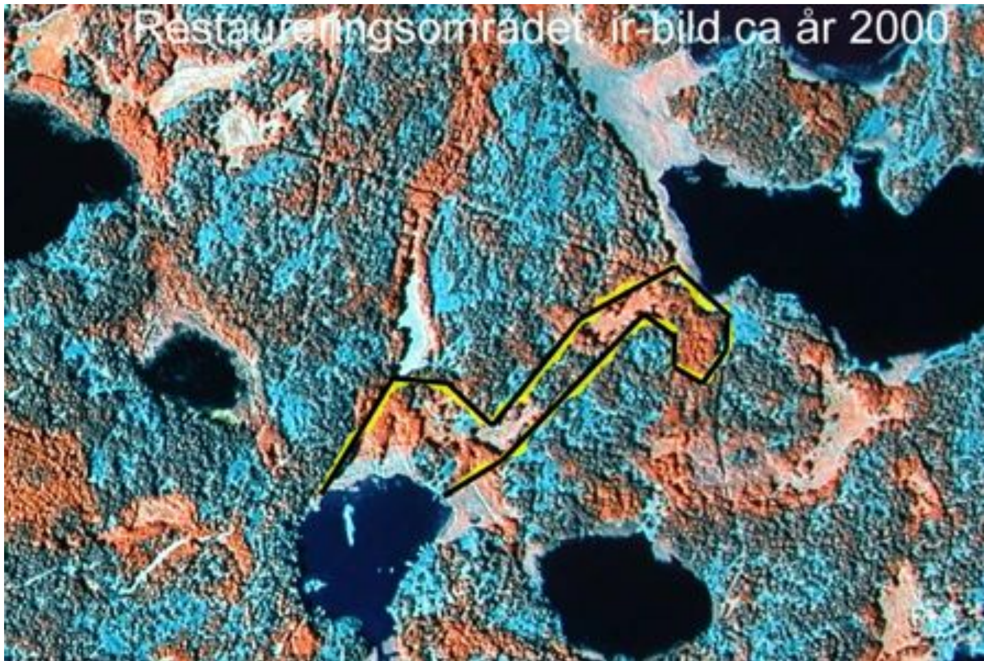
Ir-bilden visar lövträdens kronor i rött. En Jämförelse med flygfoto från 1960 visar igenväxningen.