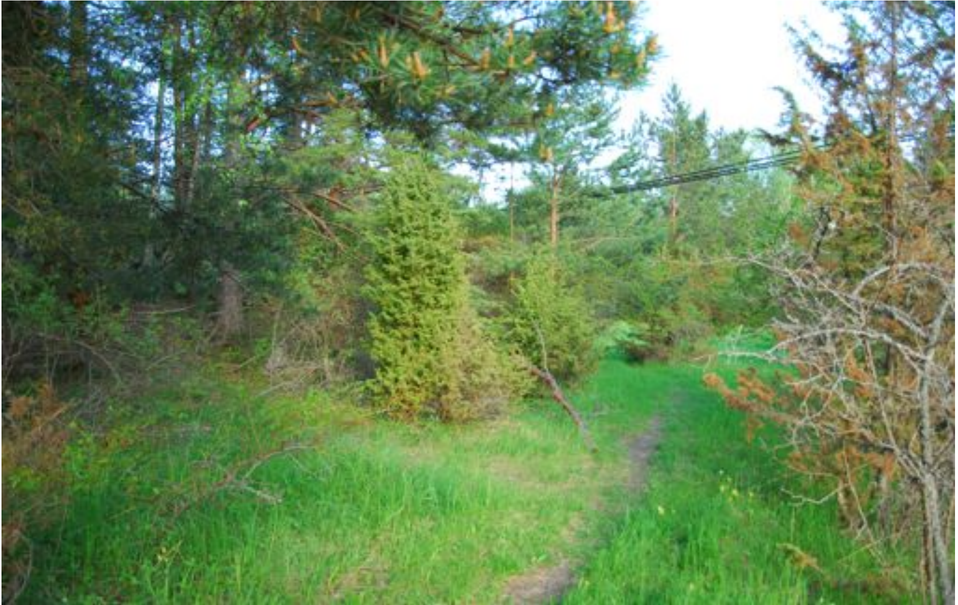
Område m, vy österut mot omr. n. Värdefull brynmiljö med grov tall, en, nyponbuskar (som erbjuder nektar och bär) och välbevarad hävdflora. Döda enar tas bort. (2010-05-24).