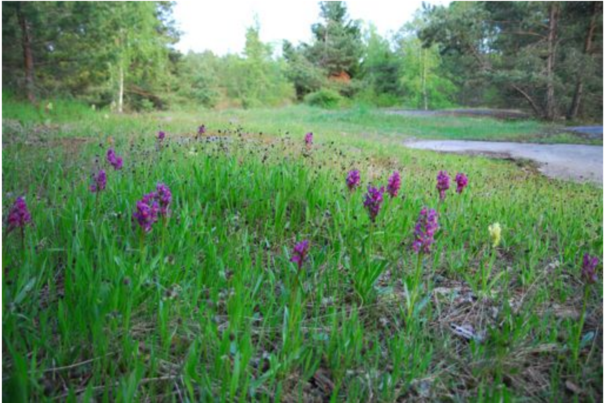
Område m, del med torräng och hällar (omr c och d) (2010-05-24). Stort bestånd med Adam & Eva (480 individer räknades). Höga naturvärden knutna till floran. Särskild hänsyn krävs. 10