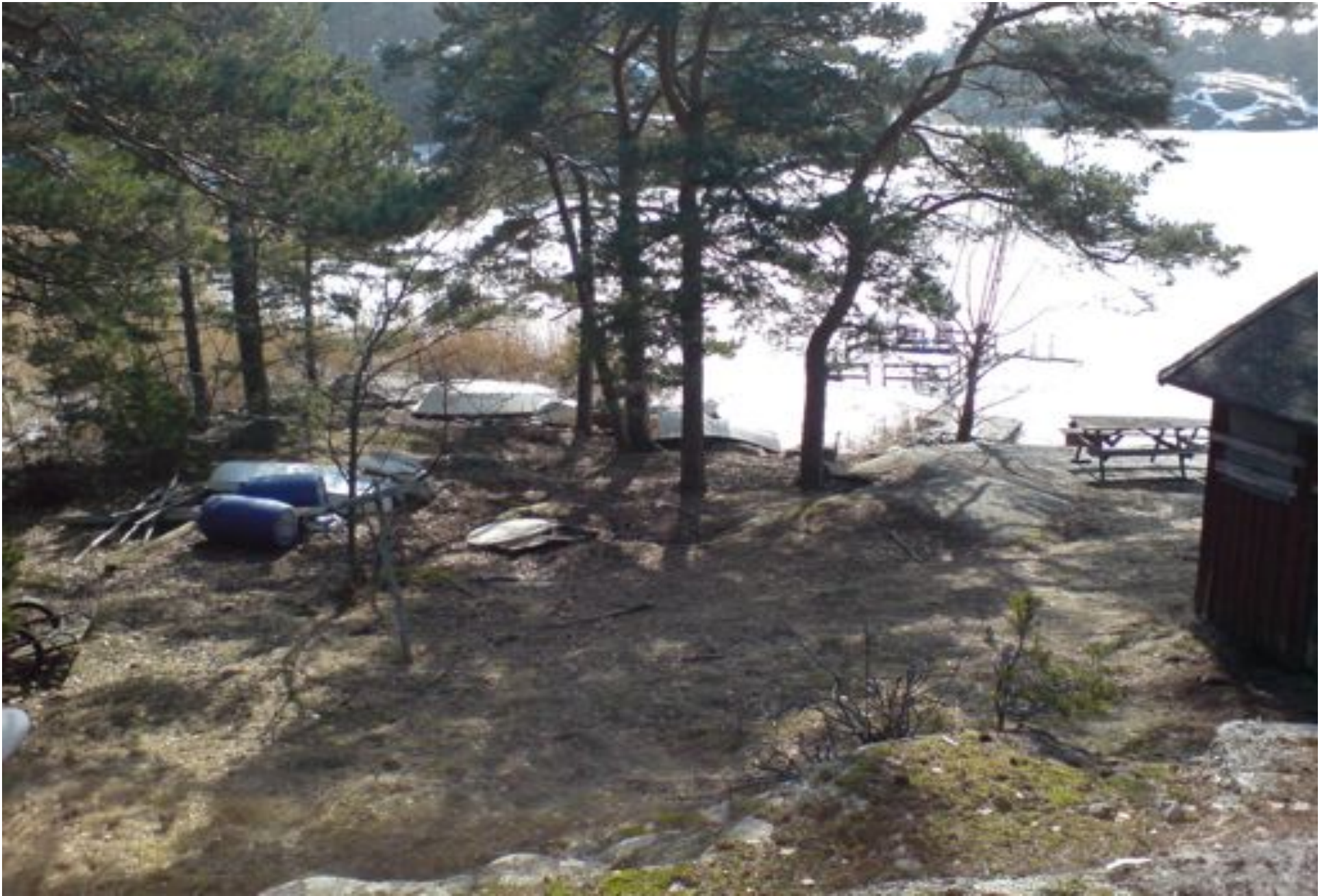
Område I. Skogsbacke med klippstrand mot Femsund. Området innehåller två backar och delas av en smal sänka. 2010-04-02.