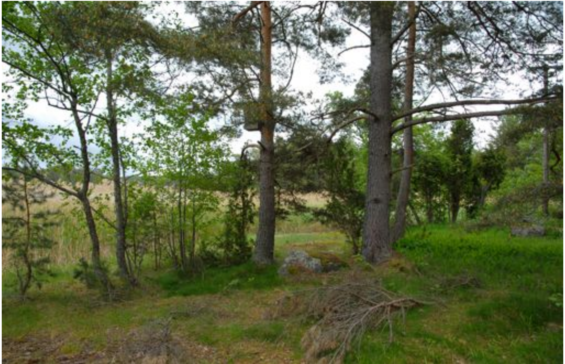
Område S mot Stora Kastet. 2010-06-14 Mosaikartat område. Hällar och värdefulla träd. Området har trädkontinuitet men var betydligt öppnare 1960. Träd yngre än 50 år fälls med undantag för rönn och lämpliga efterträdare till gamla träd. 25