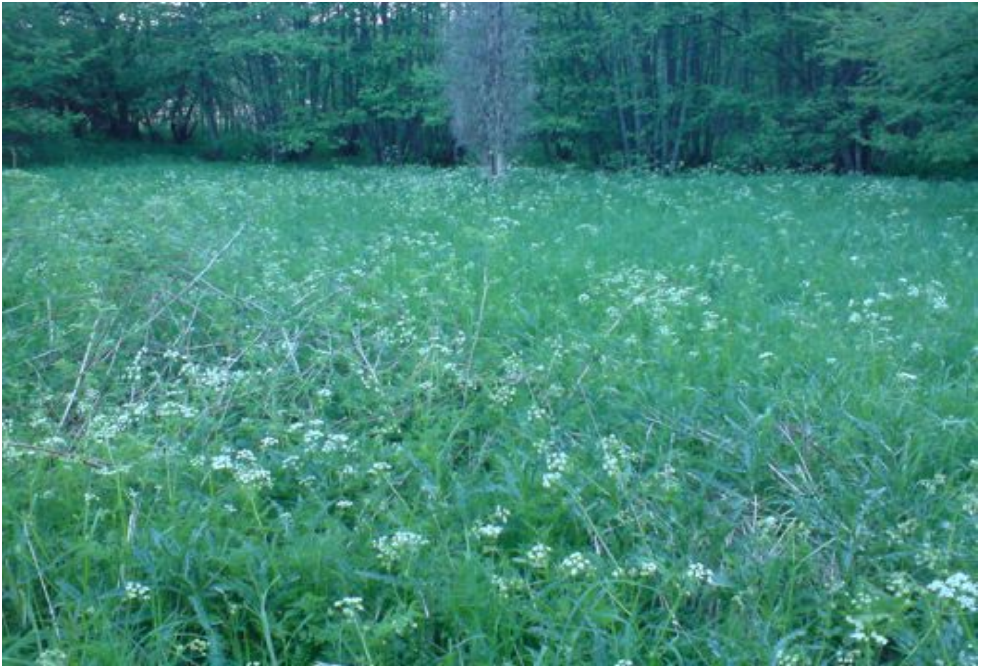
Område n. Frodig, högvuxen vegetation i delen mot Femsund. Hundkex och åkertistel hoppas vi ska minska när marken betas kontinuerligt. 2010-06-03.