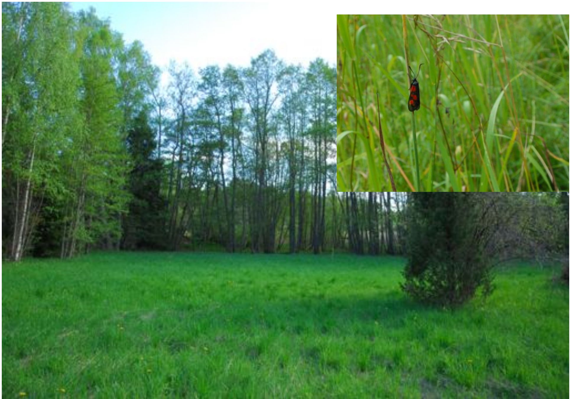
Område n. (2010-05-24). Sexfläckig bastardsvärmare, rödlistad art knuten till det gamla odlingslandskapet, påträffades 2010-07-22