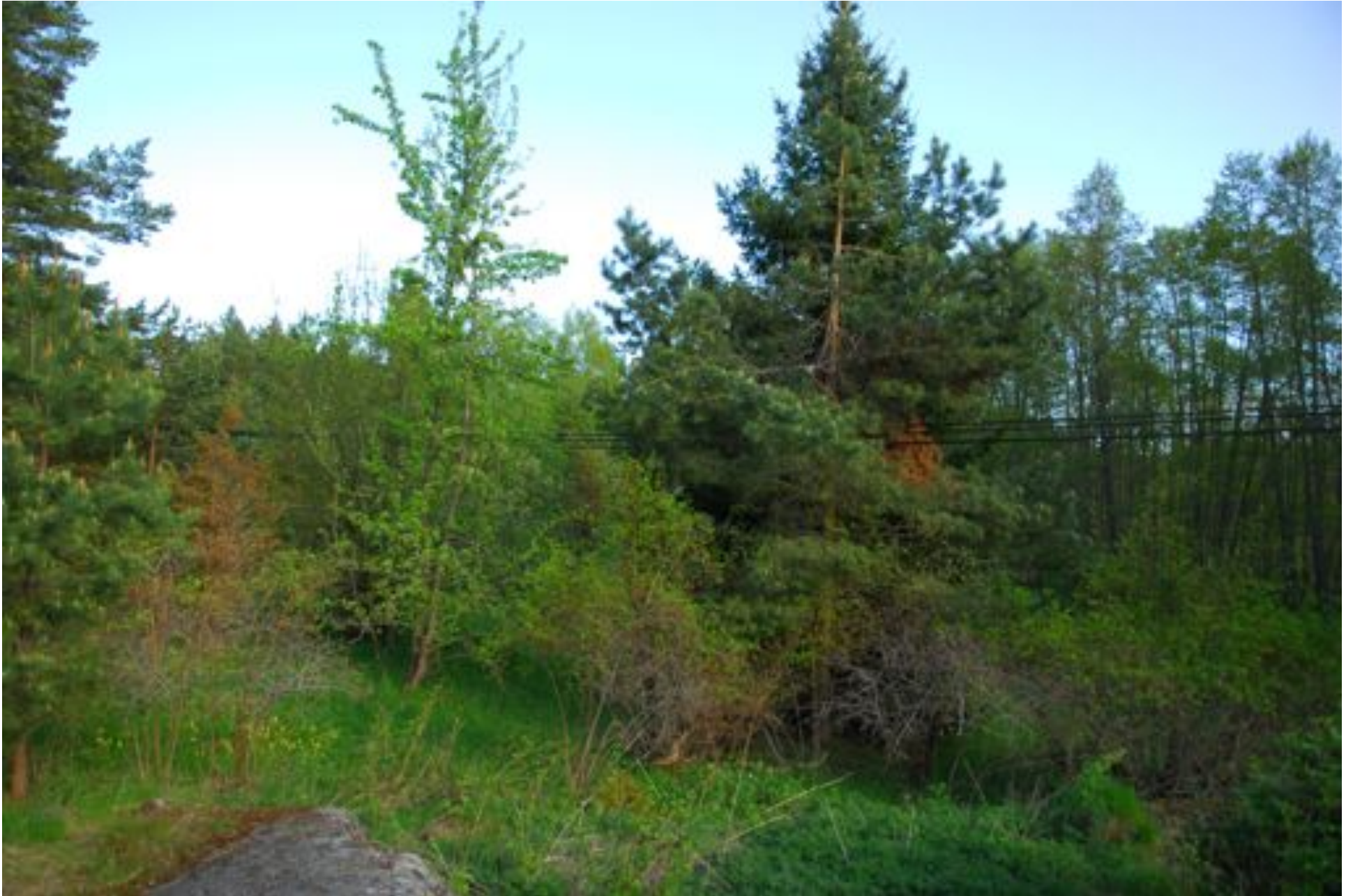
Område m och n. Häll i omr. d. Spara vitala buskar och fruktträdet. Fäll igenväxningsträden.