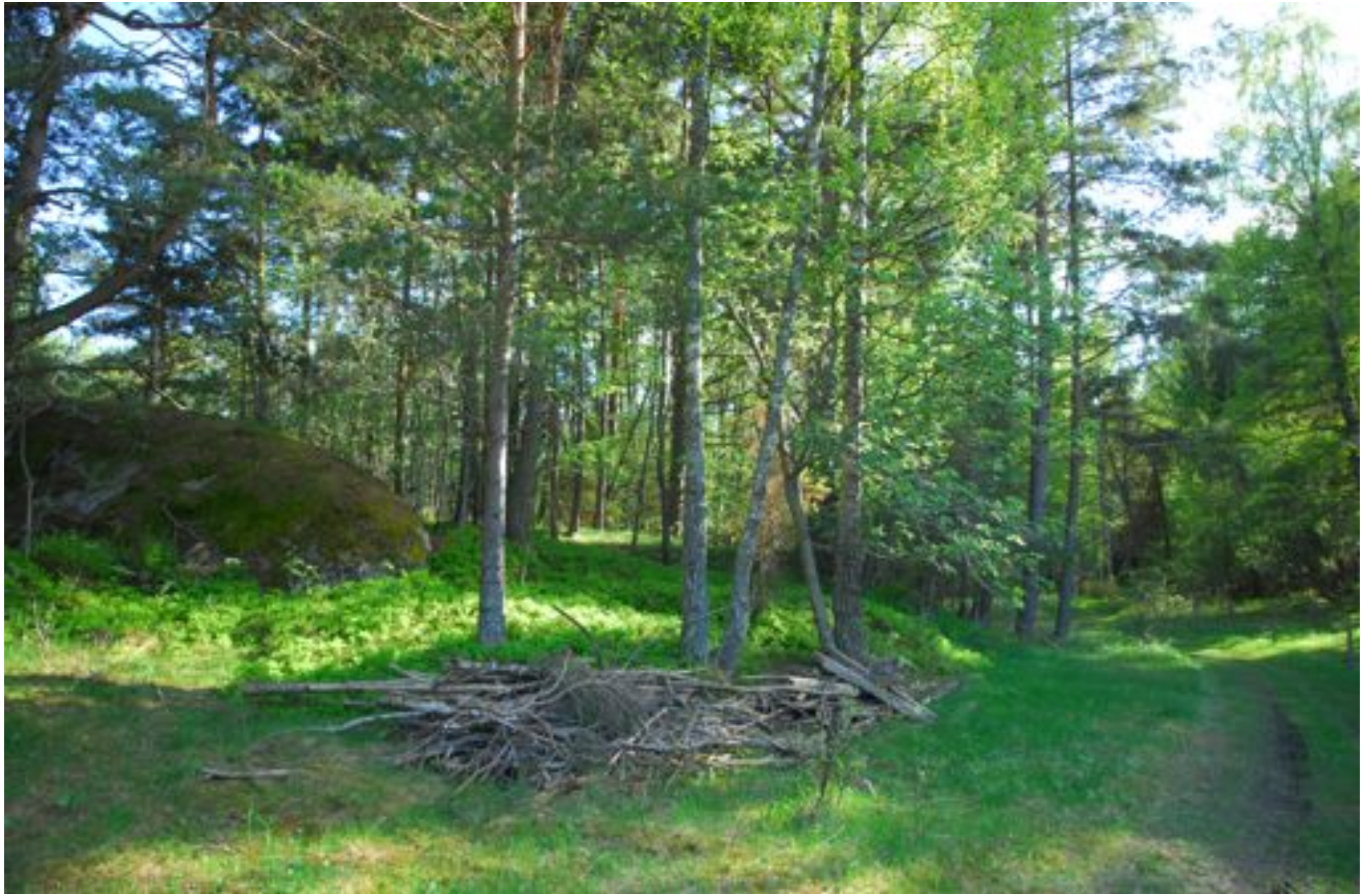
Område a. Skogsbacke söder om Djupdal med trädkontinuitet med grovgrenig tall. Trädformig 7 rönn är karaktäristiskt. Träd yngre än 50 år fälls med undantag för rönn och lämpliga efterträdare till gamla träd. 2010-05-24