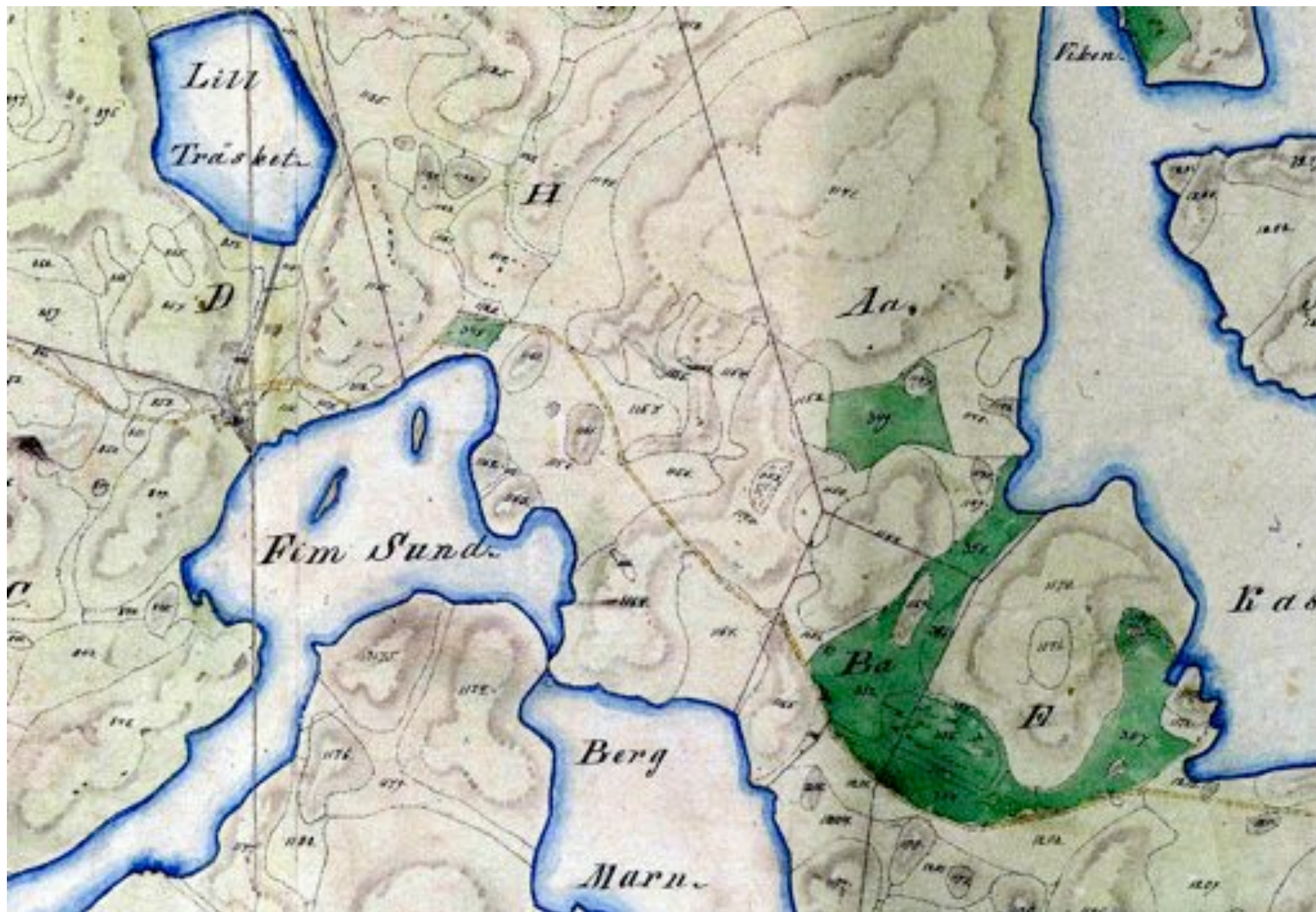
Karta från 1847, upprättad vid laga skiftet. Grönt är inäga, slätteräng.