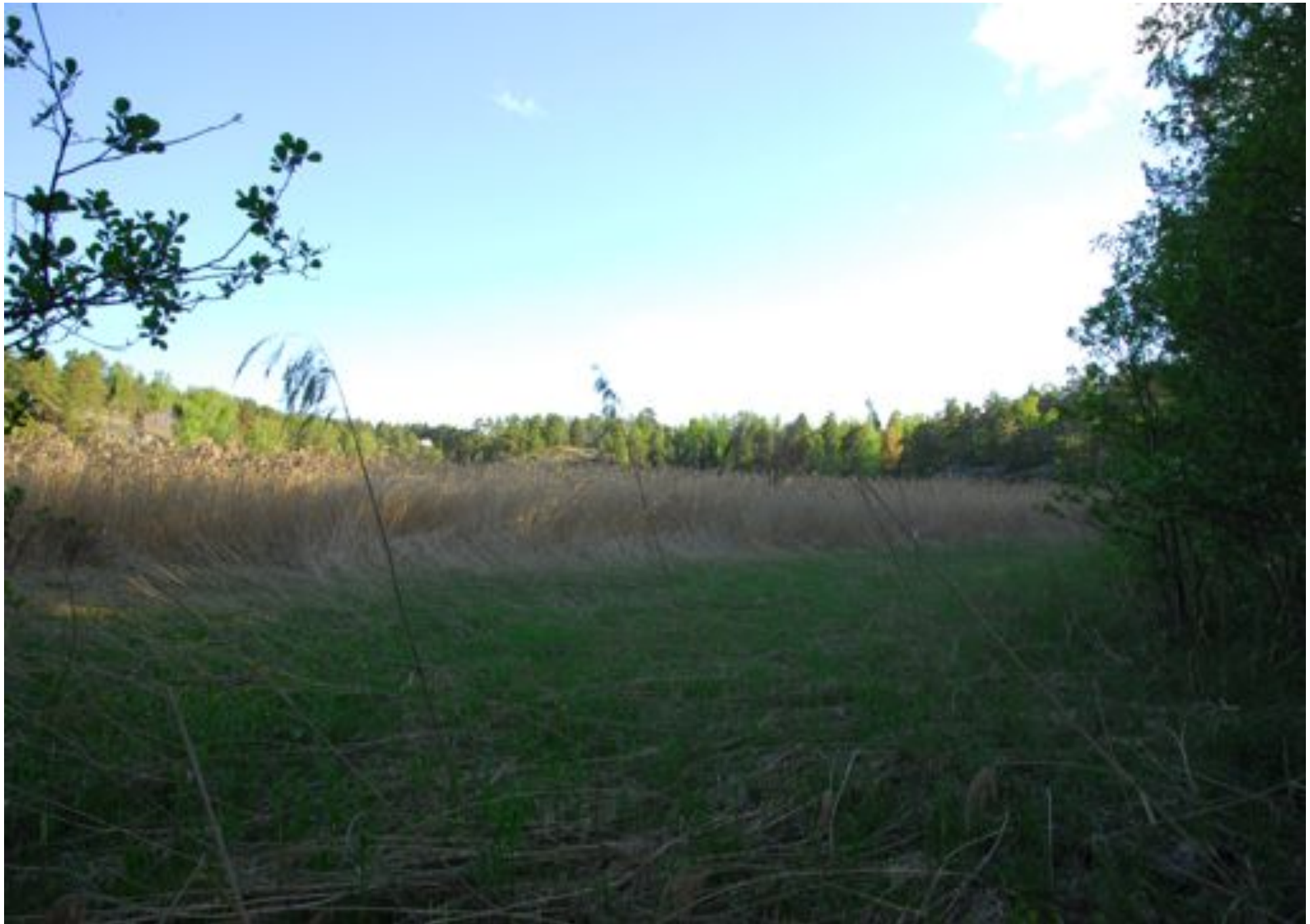
Igenväxt strandäng, omr h. Vassbekämpning inledd 2010.