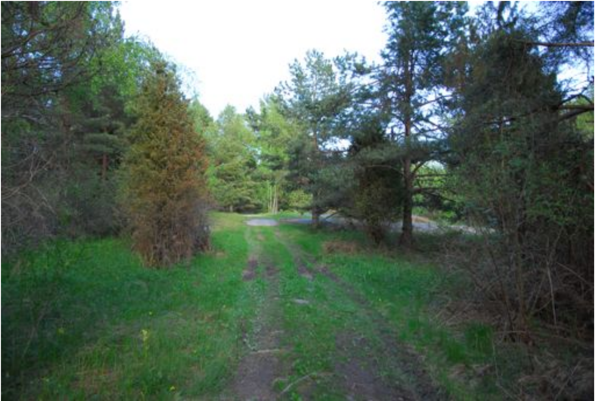
Område m (häll i omr. d) Gullviva syns i förgrunden. Igenväxningen består här av tallar. Döda enar och nyponbuskar tas bort med vitala buskar lämnas. (2010-05-24)