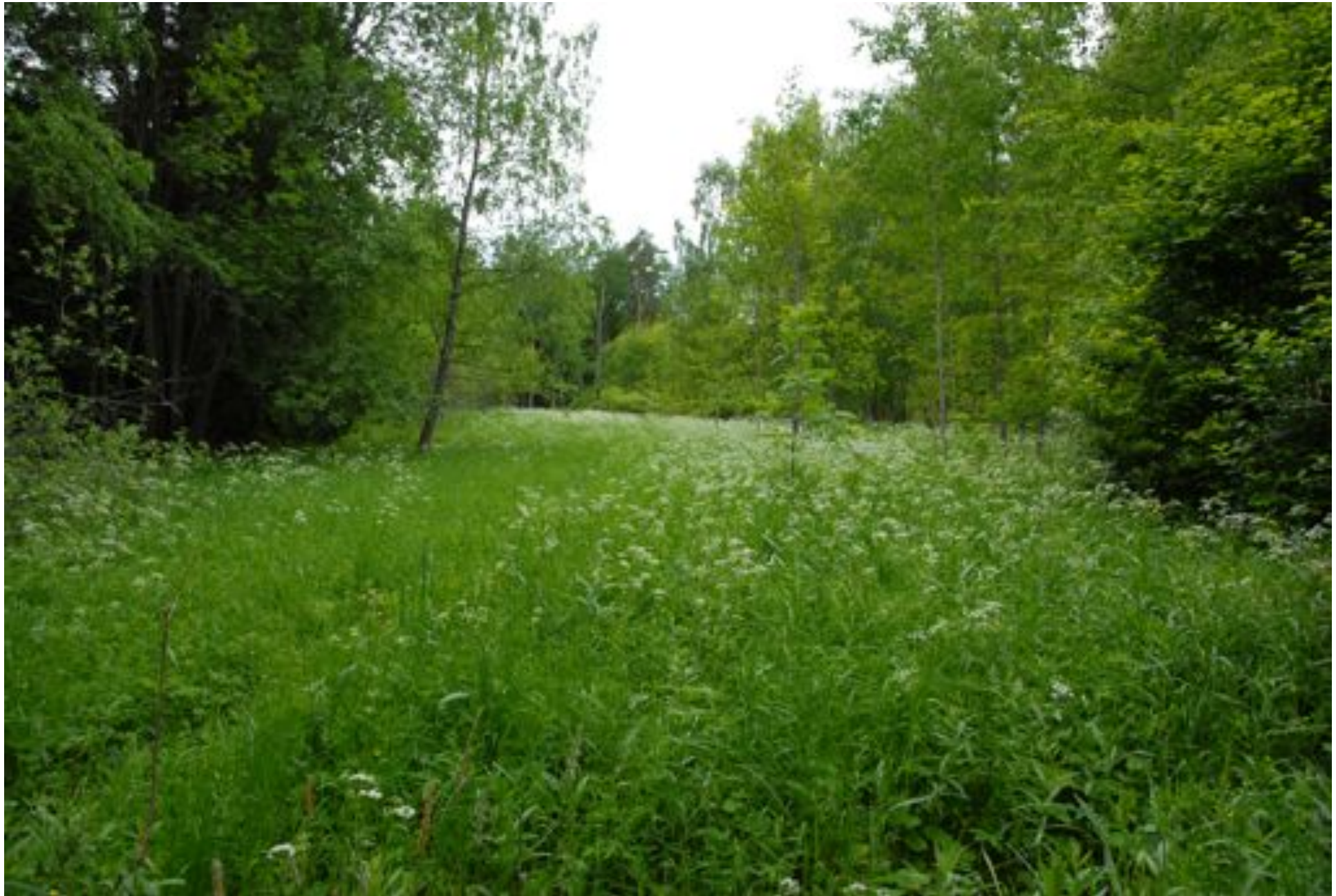
Långvarpet. Område o. Slatteräng 1847. Plöjt 1950-tal. Här sjönära delen som är frodig (örnbräken, hundkex, höga gräs). Här kan bränn och rishögar förläggas. 2010-06-14