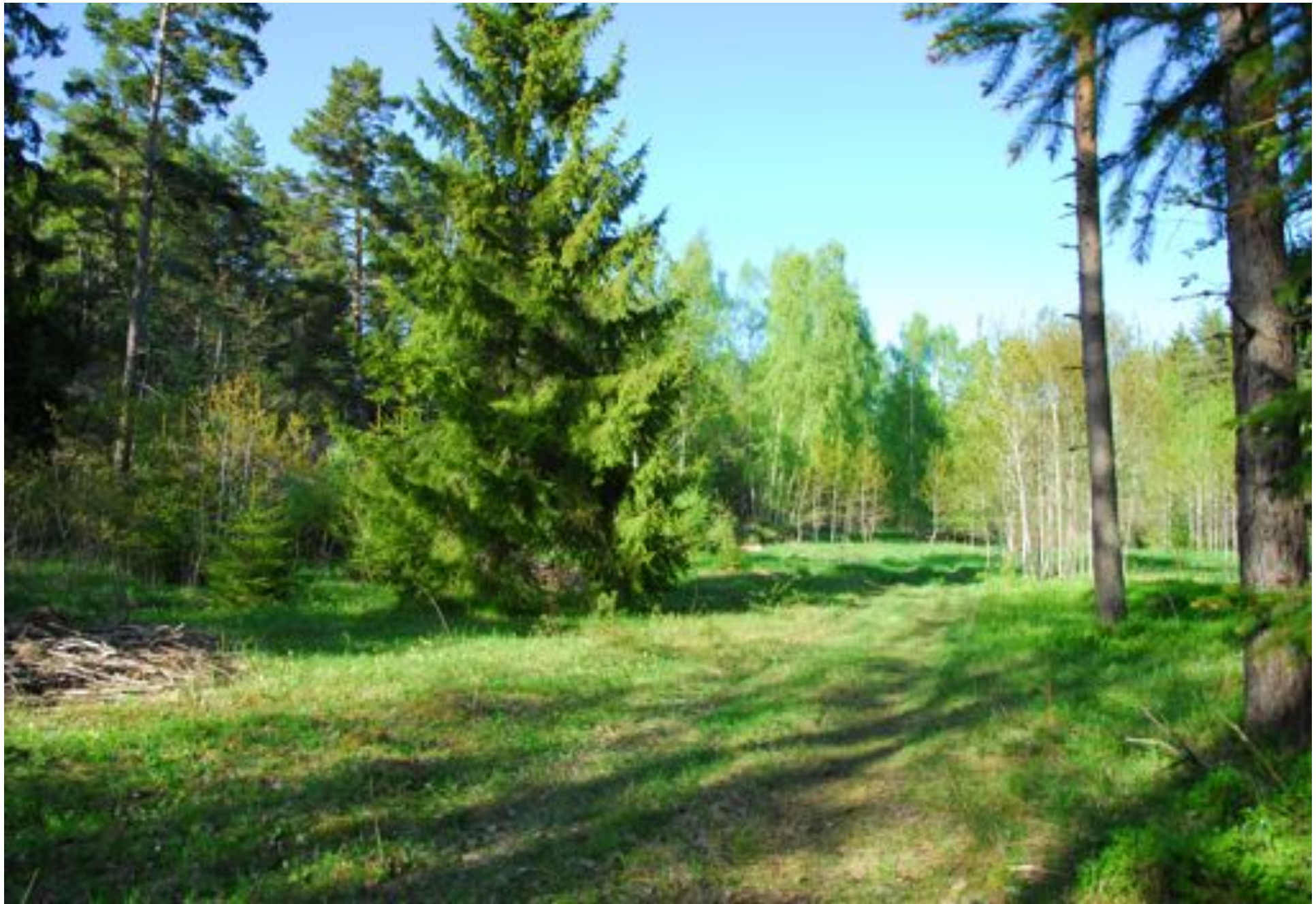
Långvarpet. Område o, östra delen. Slåtteräng 1847. En kortare period av åker i början av 1900-talet. Plöjt med den nya bolagatraktorn 1952. Slåttervall och havre fram till 1959. 2010-05-24 22